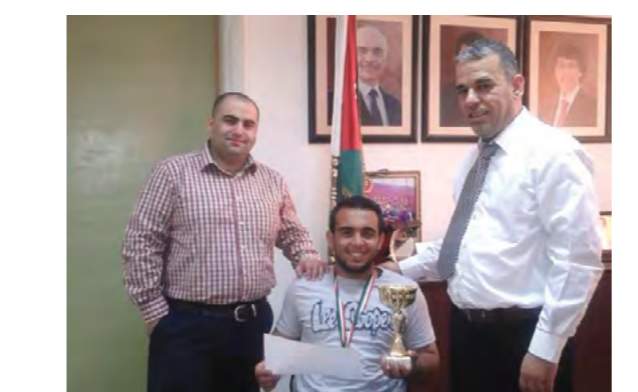
كلية الأمير الحسين بن عبدالله الثاني لتكنولوجيا المعلومات تكرم نخبة من طلبةها

أحب الصالحين ولست منهم وأكره من جارته المعاصي ..... بخاطبني السفه بكل فيح فأكره أكون له مجيبا ..... يزيد سفاهة فايزد حلما كعود زاده الإحراق طيبا ..... شكوت إلى وكيع سوء حظي فأرشدني إلى ترك المعاصي وأخبرني بأن العلم نور ونور الله لا يهدى لعاصي ..... علي ثياب لو يباع جميعها بفلس لكان الفلس منهن أكثرا وفيهن نفس لو نفاس ببعضها نفوس الوري كانت أجل وأكبرا