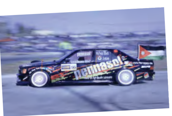
عذسة الطالب: طارق التركمان طلبة اللجنة الإعلامية