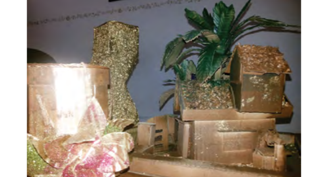
دائرة النشاط الثقافي والفني تنظم دورة (إعادة تدوير المواد)