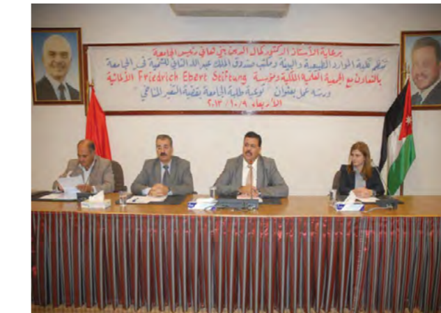
الجامعة الهاشمية تعقد ورشة عمل تدريبية لرفع مستوى وعي طلبةها بقضايا التغيير المناخي

ضمن رؤية إدارة الجامعة الهاشمية في جعل الجامعة سباقة في بحوث وتطبيقات الطاقة المتجددة ولاسيما الطاقة الشمسية. افتتح رئيس الجامعة الهاشمية الأستاذ الدكتور كمال الدين بني هاني "مشروع الطاقة الشمسية البحثي الثاني الريادي" بقدرة (٣٠ كيلواط (KW ٣٠) في حرم الجامعة؛ بما يعادل تقريبا استهلاك شهري (٤٥٠٠) كيلواط ساعة بكلفة تتجاوز ألف دينار شهريا. ويتكون المشروع من أربعة أنظمة حديثة في الطاقة الكهروضوئية (PV) Photovoltaics من الألواح الكهروضوئية القادمة