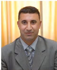
بقلم: رئيس التحرير عميد شؤون الطلبة د. يوسف عليمات

بني هاشم رهط النبي فإني بهم ولهم أرضى مراراً وأغضب خففت لهم مني جناحي مودة إلى كنف عطفاه أهل ومرحّب إليكم ذوي آل النبي تطلعت نوازع من قلبي ظمء وألبب