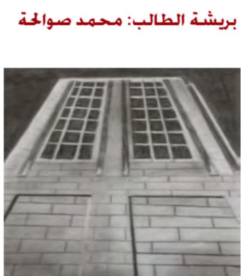
بريشة الطالبة: سلام المجالي