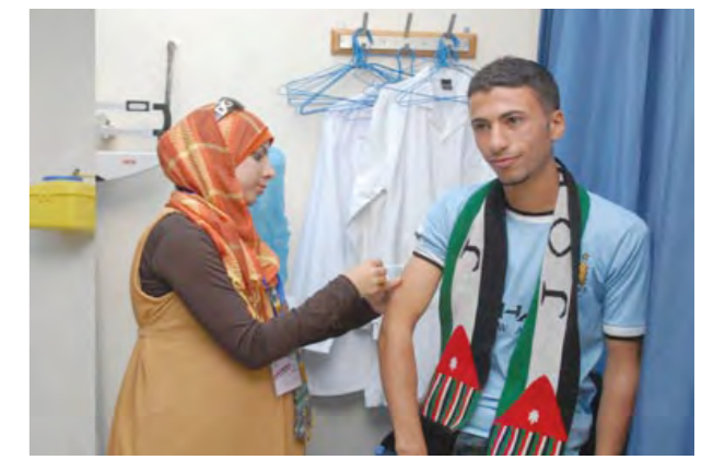
بدء حملة التطعيم ضد الحصبة والحصبة الألمانية لطلبة السنة الأولى والثانية في الجامعة الهاشمية

* دائرة النشاط الرياضي تنظم لقاءً تعريفياً بجائزة الحسن للشباب