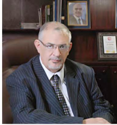
الأستاذ الدكتور: كمال الدين بني هاني رئيس الجامعة