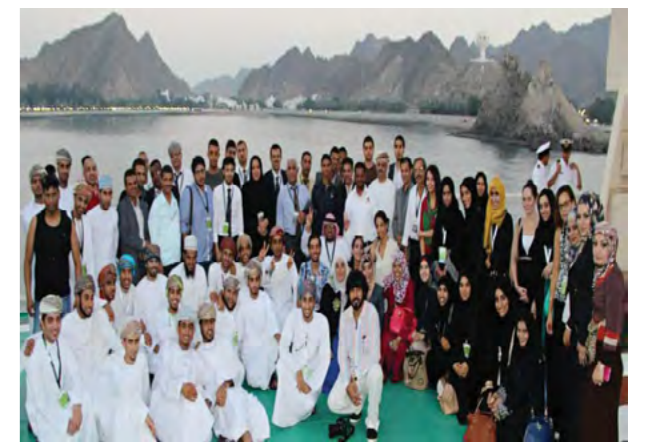
طلبة كلية الموارد الطبيعية والبيئة يحصدون جوائز المنقش العربي الأول في تخصص الجيولوجيا والبيئة الذي عقد في جامعة السلطان قابوس في سلطنة عمان