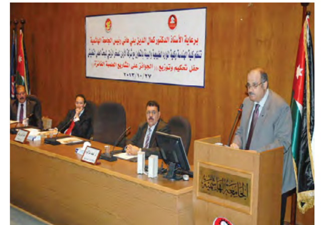
طلبة كلية الموارد الطبيعية والبيئة في الجامعة الهاشمية يفوزون بالأبحاث التطبيقية في مجالات الصخر الزيتي والياه