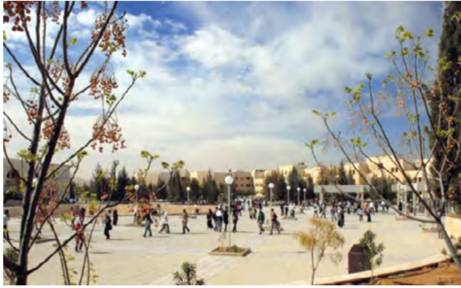
يعضي الطلبة بين اروقه الجامعة أربع سنوات. بعضهم يبحث فيها عن مقعد فكري تنموي ، وآخرون عن مقعد هزلي استعراضي . الفرق بين الاثنين ليس بالمفردات المذكورة، بل بوعيها الاعرابي على الجامعة . فليس بالضرورة أن نجد الأول دائما من رواد المكتبة

والا يحمل غيابا واحدا ومتواجدا بالصف الأول من المحاضرات . فهو طالب يعيش حياة عادية جدا ويحمل رغبات عادية لكنه بالحصلة لكل افعاله تبقى خَنت فيه انه مسالم . هدفه الحصول على النعمة الجامعة الفكرية الاجتماعية العلمية. لا نقل الترهات الفوضوية العصبية العنوائيه العائمة للجمع الخارجي الى داخل الاروقة الساكنة. فيعجزها الضحيح المجتزع من كون انها اروقة جامعة حقاً.