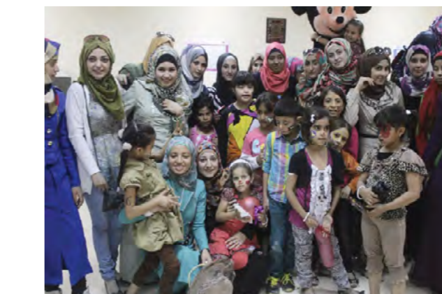
طلبة كلية العلوم الطبية المساندة يستضيفون مجموعة من الأطفال الأيتام ويوزون مركز الأميرة منى للمسنين