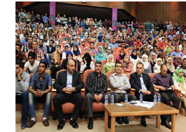
حفل استقبال الطلبة المستجدين في كلية الأمير الحسين بن عبدالله الثاني لتكنولوجيا المعلومات